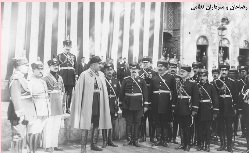
رضاخان و سرداران نظامی

کابینه سیدضیاء برای اختلافی که با رضاخان داشت، منحل گردید و به اصطلاح روز کابینه سیاه به هم ریخت و تبعید شد. تا ۱۹ آبان ۱۳۰۲ سردار سپه رییس‌الوزراء شد و کلید همه امور و انتخابات به دست او و شرکت نفت و در واقع سفارت انگلیس بود. و این طلای سیاه نفت اوضاع و سلطنت و دولت به هم ریخت. سه نفر مورد توجه برای کودتا بودند: امیرمفخم و نصرت الدوله و سیدضیاء. از شرحش می‌گذریم. بعد که سیدضیاء را کنار گذاشته و رضاخان سردار سپه برای جمهوری و پر از مشکلات و مخالفت‌ها برای سلطنت در نظر گرفته شد و مجلس پنجم مأموریت این امور را داشت، تمام انتخابات برخلاف قانون و با زور و دستور بود در تهران به طرز خاصی شد. و با اینکه مرحوم دکتر مصدق و مستوفی و میرزا سیداحمد بهبهانی و مرحوم مدرس به ترتیب و بعد از دیگران مشیرالدوله پیرنیا و مؤتمن‌الملک پیرنیا انتخاب شدند و سه جلسه از این دوره مؤتمن‌الملک پیرنیا رییس و مرحوم مدرس نایب رییس بودند؛ در دوره جلسات اخیر تفصیل زیادی است و بالاخره با ممانعت مرحوم مدرس و دکتر مصدق و دیگران برخلاف قانون و برخلاف میزان به نایب رییس سیدمحمد تدین انقراض قاجاریه و تشکیل مجلس مؤسسان تصویب و پس از این اقدامات و نصب سردار سپه در تاریخ ۱۴ اردیبهشت ۱۳۰۵ شمسی رضاخان سردار سپه تاجگذاری کرد که جلسات آن خواندنی است و مخالفت مردم و بالخصوص علمای عظام چشم گیر بود. و چون از مأموریت رضاخان و اموری که برخلاف اسلام و ایران باید انجام گیرد برجسته‌ترین علما و رجال